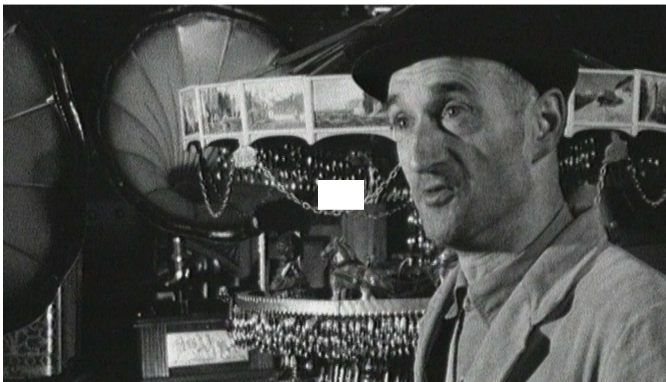
Continents sans visa - Publié le 23 décembre 1960