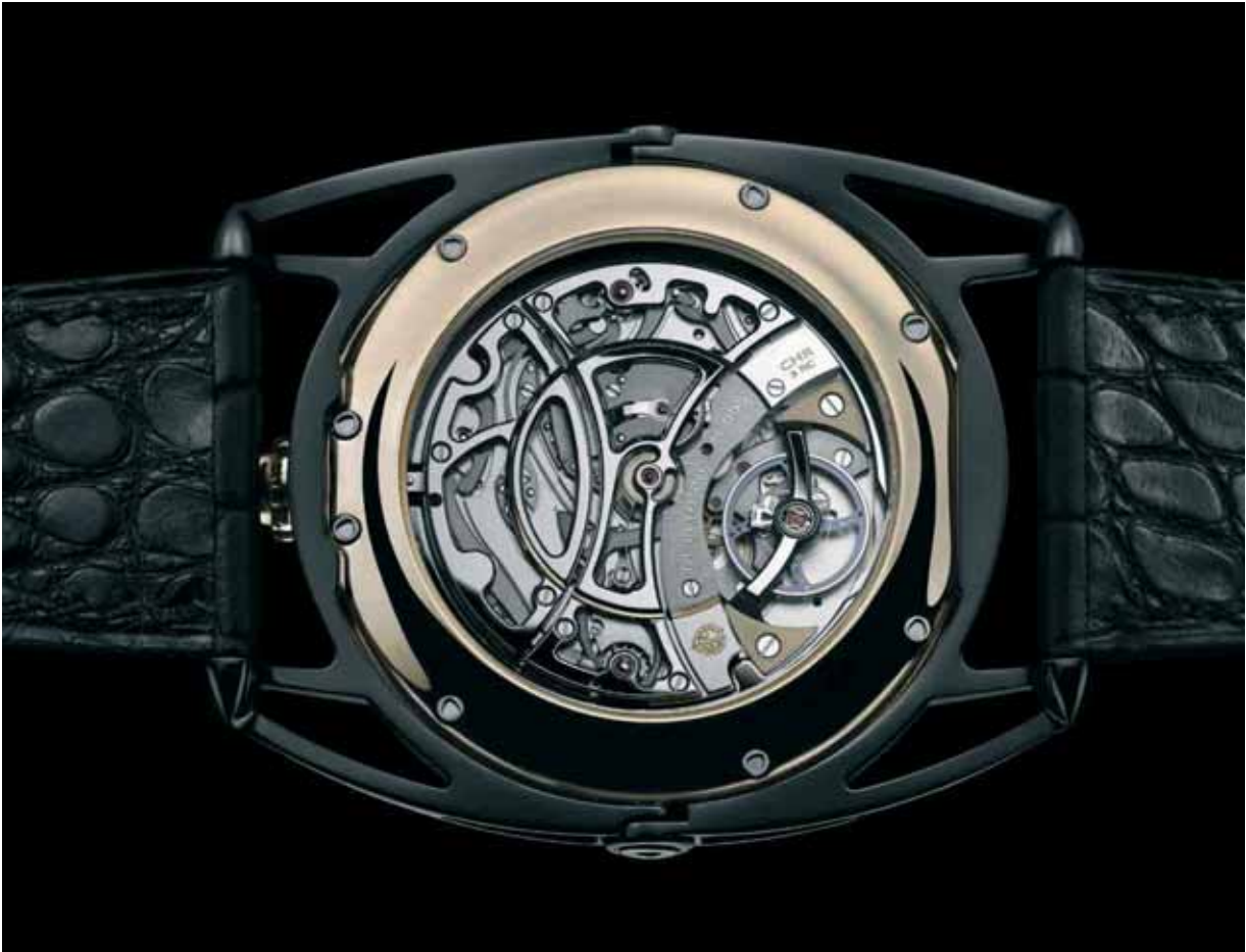
DB28 Maxichrono

Fin XIX e siècle, après l'épanouissement, l'élan du grand siècle des Lumières, l'horlogerie entre dans l'ère industrielle. Ce sont les débuts de l'aviation, de l'automobile. La philosophie est guerrière. La montre doit être au poignet. L'Homme est fier et victorieux ; le temps est maîtrisé. Il appartient à celui qui le porte. Et à Louis Cartier qui les fabrique. Le portatif élégant. La recherche esthétique n'est cependant pas récente. De Louis XIV à Louis XVI, les plus grands artistes, les plus grands ébénistes, les plus grands bronziers – Caffieri, notamment - ont travaillé pour l'horlogerie.