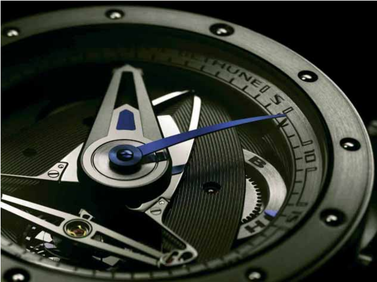
DB28 GS

Pendant près d'un siècle, ledit échappement sera utilisé par de grands horlogers, tels Pierre Le Roy.