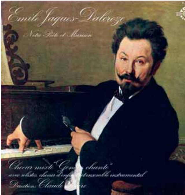
Émile Jacques-Dalcroze

Les temps forts de l'anniversaire qui nous concerne vous sont décrits par ailleurs dans cette brochure bisannuelle de l'ADAC. Il faut ici souligner l'immense et remarquable travail de préparation effectué par des membres du conseil de fondation et de la direction du CIMA. Votre comité sera bien sûr là pour prêter assistance à l'occasion des trois moments forts de cette commémoration ! Des forces supplémentaires