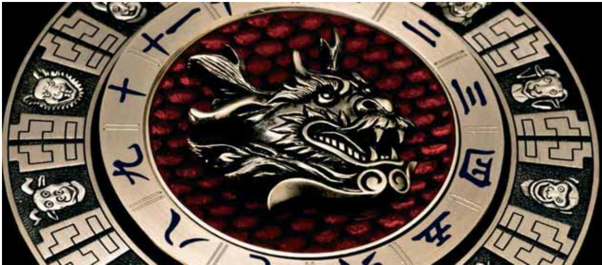
DB25 IMPERIAL FOUNTAIN

P ar une pluie battante, une matinée de giboulées de mars qui se seraient perdues en avril, je m'en vais à la rencontre de la maison De Béthune, la tête vierge d'hypothèses. Tout juste m'attendais-je peut-être à une bâtisse frappée de lettres d'or ; un écusson, un quelconque symbole héraldique.