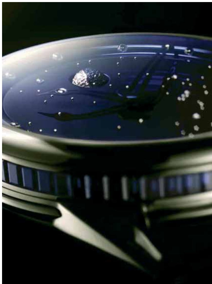
DB 25s Jewellery closeup