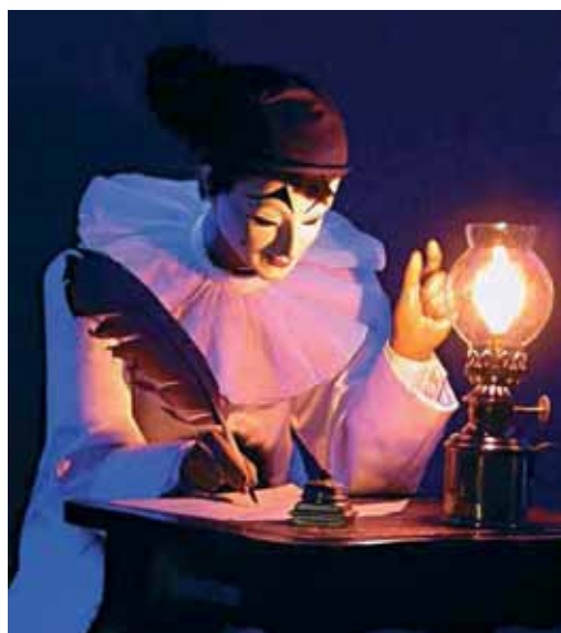
Association des Amis du CIMA

En faveur de Association des Amis du CIMA Compte H740 923 3 Clearing 767 IBAN CH8100767000H07409233