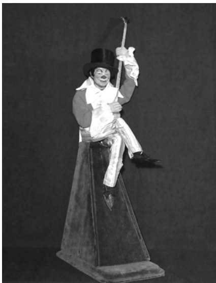
Musée de Souillac, Clown au banjo

Ne manquez pas l'occasion unique de découvrir ces magnifiques objets à Sainte-Croix, ceci sans devoir traverser la France dans toute sa largeur !