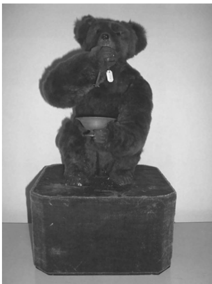
Musée de Souillac, Ours faisant des bulles de savon