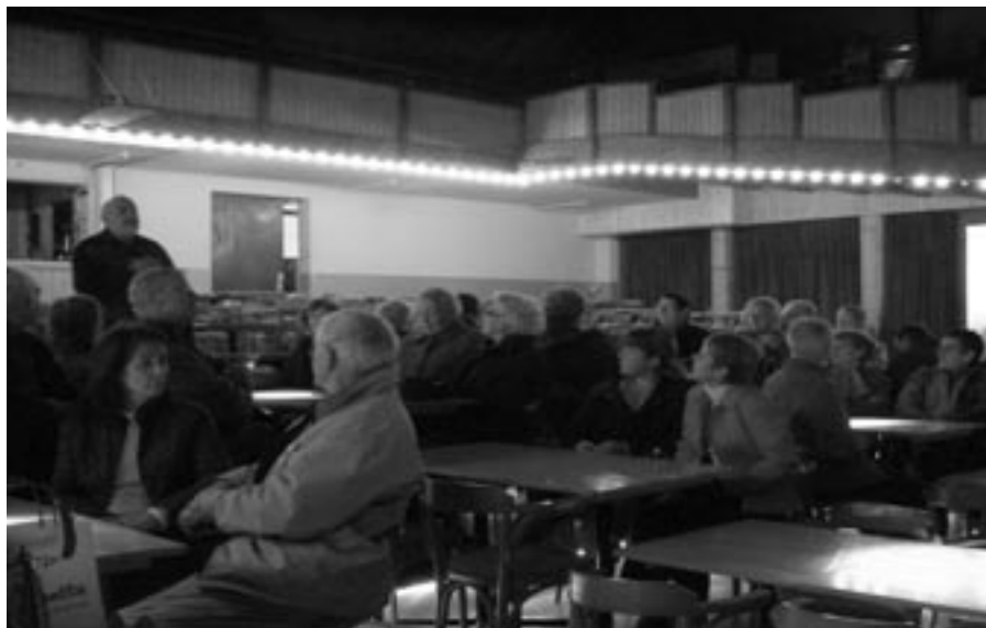
Chez Barnabé à Servion : présentation des orgues du théâtre