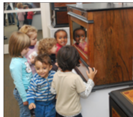
Découverte d'un automate de gare.