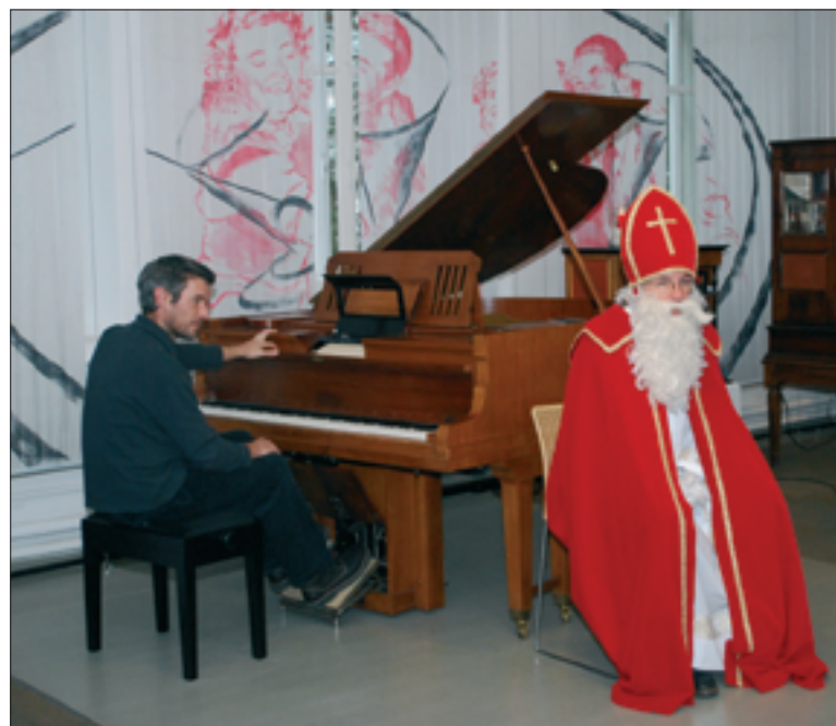
Le Père Fouettard et saint Nicolas ont raconté des histoires aux enfants.