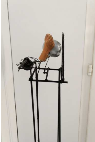
Petit Prisonnier (1988)