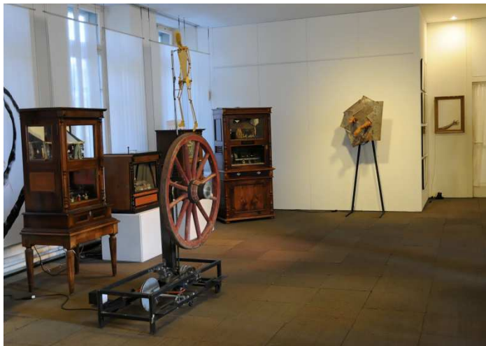
Marcheur 4 (2011) Stranger in the night (1998) Au revoir ! (1999)

La version numérique de ce dossier ainsi que les visuels ci-dessous sont à la disposition des journalistes. La reproduction des photos est autorisée en mentionnant la source. Tous les documents peuvent être obtenus en format numérique sur simple demande au musée CIMA.