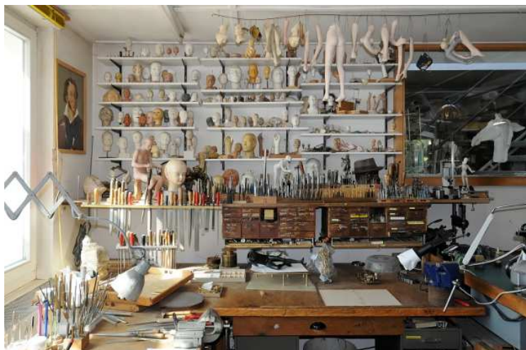
Atelier François Junod