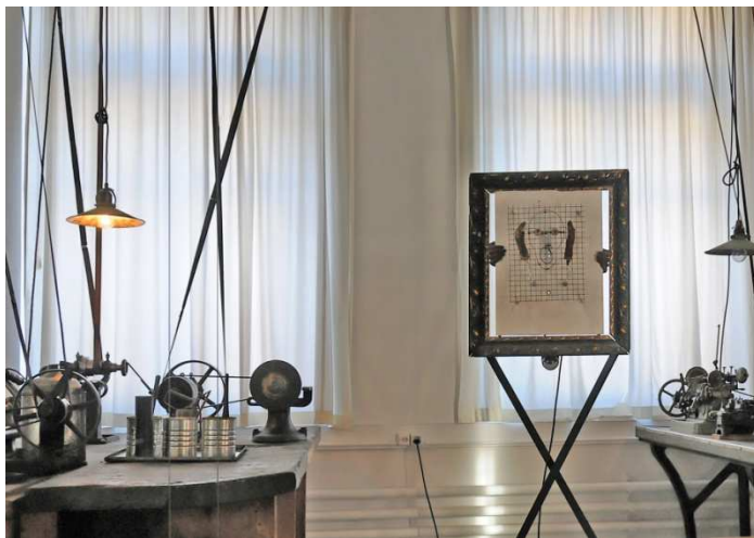
Le Cri (1988)