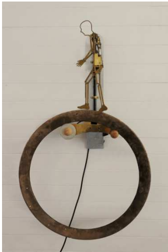
Marcheur 1 (1999) © Musée CIMA