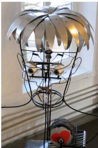
Grande Palmette (2003)