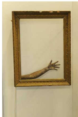
Au revoir ! (1999)