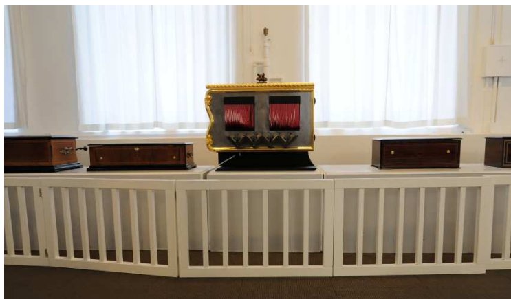
Théâtre musical (2010)