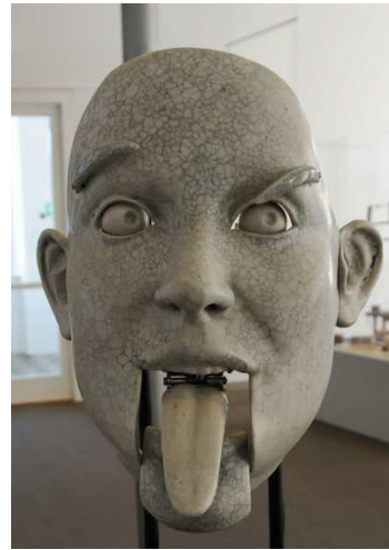
Tête porcelaine (2009) (sculpture Denis Perret-Gentil)