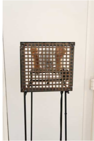
Petit Prisonnier (1988)