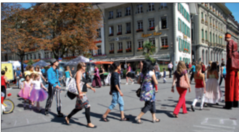
En rythme sur la place Fédérale.