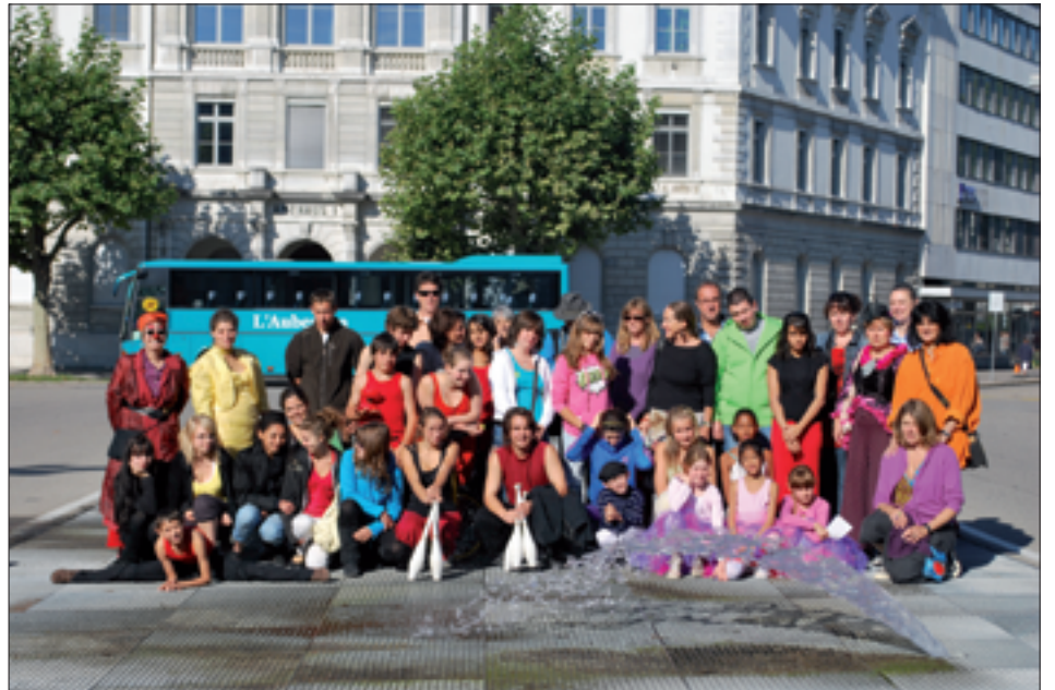
Une journée magnifique pour les participants à cette promotion.

Après plusieurs répétitions, tout était prêt, et rendez-vous était donné, samedi dernier, aux quarante participants regrou-