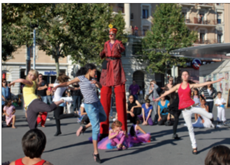
Place de la Navigation, à Lausanne.