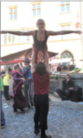
Place de la Fontaine, à Bienne.

Il y a quelques semaines, à la suite d'une discussion, et de recherches d'idées, entre les membres de l'association des amis du CIMA, sur des moyens de promotion sur l'exposition de boîtes de gare qui se tient au musée, le mot « flash mob » a été lâché.