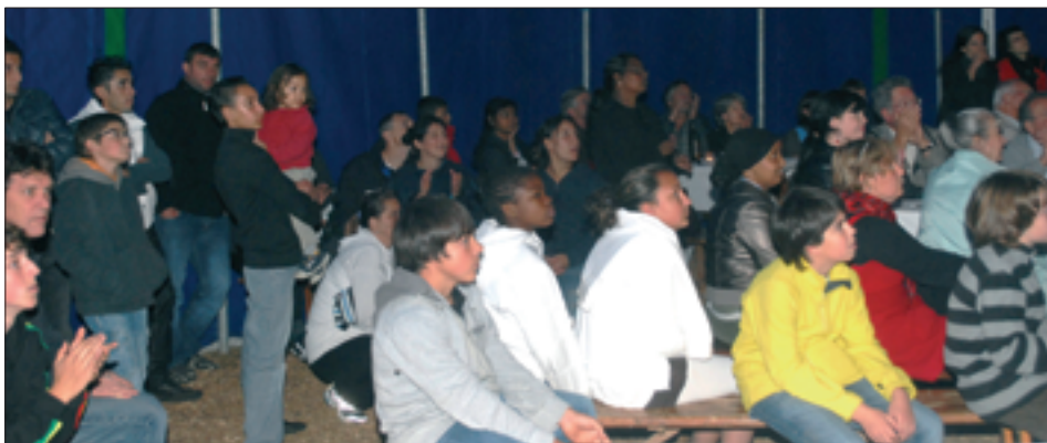
Un chapiteau rempli de spectateurs conquis.