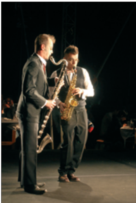
« Monsieur Saint-Glinglin et Edouard ».

Conçue comme une scène ouverte, cette soirée a permis de (re)découvrir des artistes exceptionnels et généreux dans leurs efforts, et le clou du spectacle restera sans conteste le spectacle du feu, offert