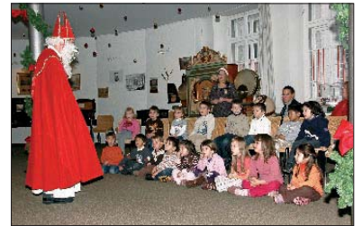
Face au saint homme.