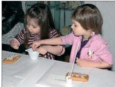
Une perle d'argent pour mon biscôme !

Saint Nicolas : Oui, oui, les trois enfants. Vous les retrouvez à côté de ma statue dans l'église de Mauvages; c'est dans la Meuse, en Lorraine. Les trois petits enfants, ( saint Nicolas fait une pause, comme si ça lui coûtait de raconter cette histoire ), c'est assez effrayant. Après s'être perdus, ils ont demandé l'hospitalité à un boucher. Et celui-ci les a tués et mis dans du sel. La légende veut que je sois passé par là sept ans après et que je les aie ressuscités. Finalement, c'est une histoire qui finit bien et tout en ma faveur ! Quant au boucher, pour lui faire regretter son méfait, il aurait été condamné à m'accompagner. Quand nous faisons notre tournée, moi je distribue